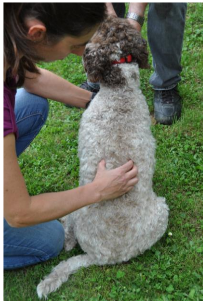
Wirbelsäule- und Muskulatur- untersuchung Rücken