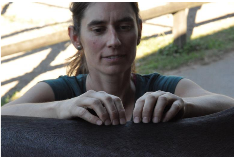
Untersuchung der Wirbelsäule