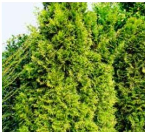
THUJA/LEBENSBAUM ( Thuja sp. )