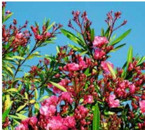
OLEANDER ( Nerium oleander )

Symptome: Benommenheit, Durchfall, beschleunigte Atmung, Herzrhythmusstörungen, zentrale Krämpfe, Tod durch Herzstillstand