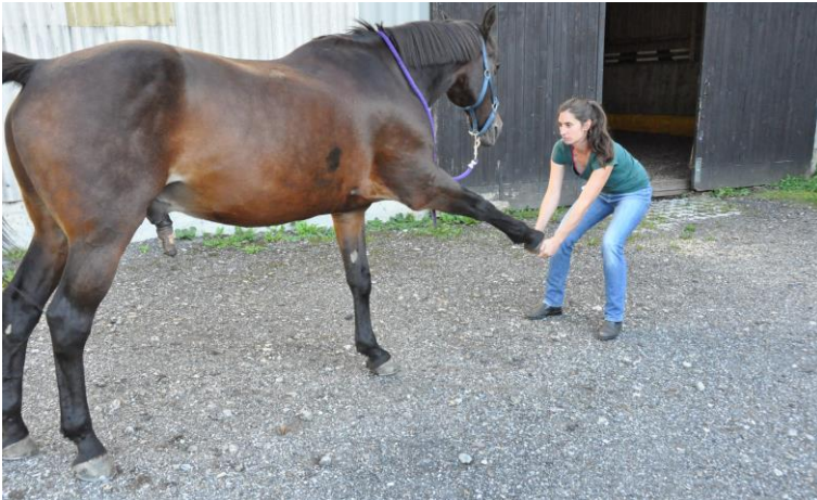
Dehnung der Schultermuskulatur