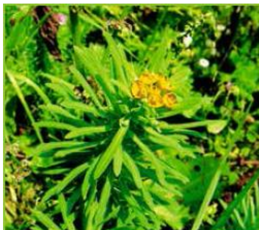
WOLFSMILCH ( Euphorbia sp. )

Symptome: Speicheln, Kolik, Durchfall, zentrale Krämpfe, Herzrhythmusstörungen, Tod durch Herz- und Atemlähmung