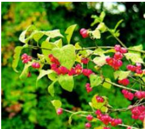
PFAFFENHÜTCHEN ( Euonymus europaeus )

Symptome: Kolik, Durchfall, Benommenheit, Muskelzittern, grosse Pupillen, beschleunigte Atmung, Herzrhythmusstörungen, Tod durch Herzstillstand