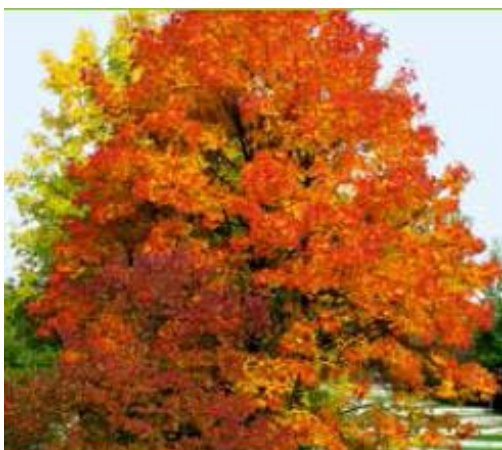
ROT-AHORN ( Acer rubrum )