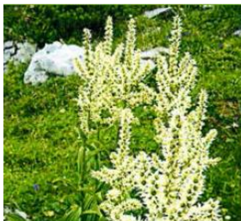
WEISSER GERMER ( Veratrum album )

Symptome: Speicheln, Kolik, Durchfall, zentrale Krämpfe, Uteruskrämpfe im letzten Drittel der Trächtigkeit, Tod durch Atemlähmung