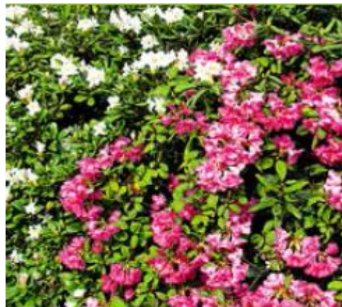
RHODODENDRON ( Rhododendron sp. )

Symptome: Kolik, Verstopfung, Herzerasen, Tod durch Herzversagen (innerhalb weniger Tage nach Fressen von Zweigspitzen möglich)