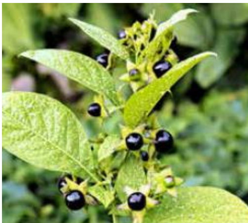
SCHWARZE TOLLKIRSCH E ( Atropa belladonna )

Symptome: Taumeln, Bewegungsstörungen, Muskelzittern, Lähmungen der Hinterhand, Zusammenbrechen, Verenden infolge Erschöpfung