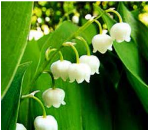
MAIGLÖCKCHEN ( Convallaria majalis )

Toxizitätsgrad: sehr stark giftig, besonders Blüten