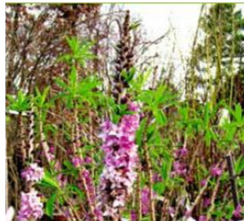
SEIDELBAST ( Daphne mezereum )

Symptome: Erregung oder Benommenheit, Durst, trockene Schleimhäute, grosse Pupillen, Herzrasen, zentrale Krämpfe, Tod durch Atemlähmung