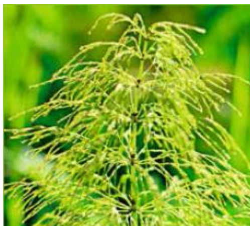
SUMPF-SCHACHTELHALM ( Equisetum palustre )

Symptome: Apathie, braune oder bläuliche Schleimhäute, Herzrasen, gelbe Lederhaut (das Weisse des Auges), Kolik, Fieber oder Untertemperatur, beschleunigte Atmung, Hufrehe, weisse Schleimhäute, blutiger Urin